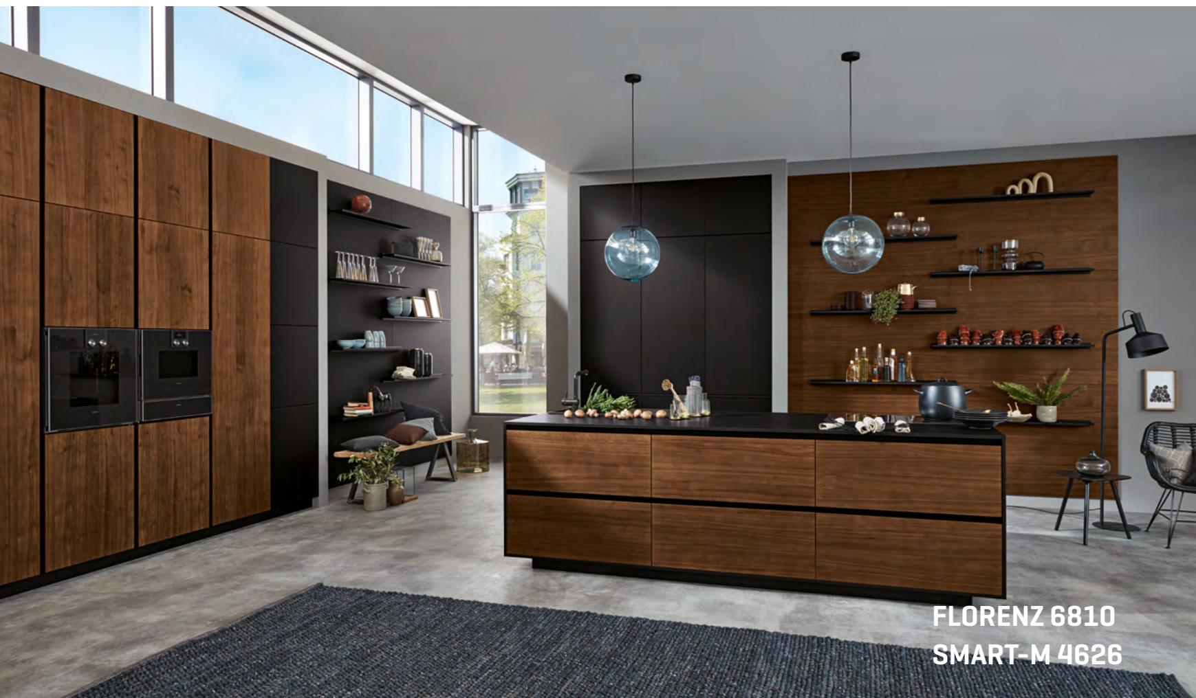
FLORENZ 6810 SMART-M 4626

Selected material quality combined with artistry: as a showpiece, the island unveils craftsmanship of outstanding beauty. Without any ifs and buts, purist design forgoing handles places every confidence on the impact of shining walnut and matt black as combination partners. Built-in unit and shelves consistently continue the horizontal lines. Gloss and transparency, grain and matt SMARTGLAS – the classy materials are the key players in this interior. A quintessence, far removed from fashion trends.