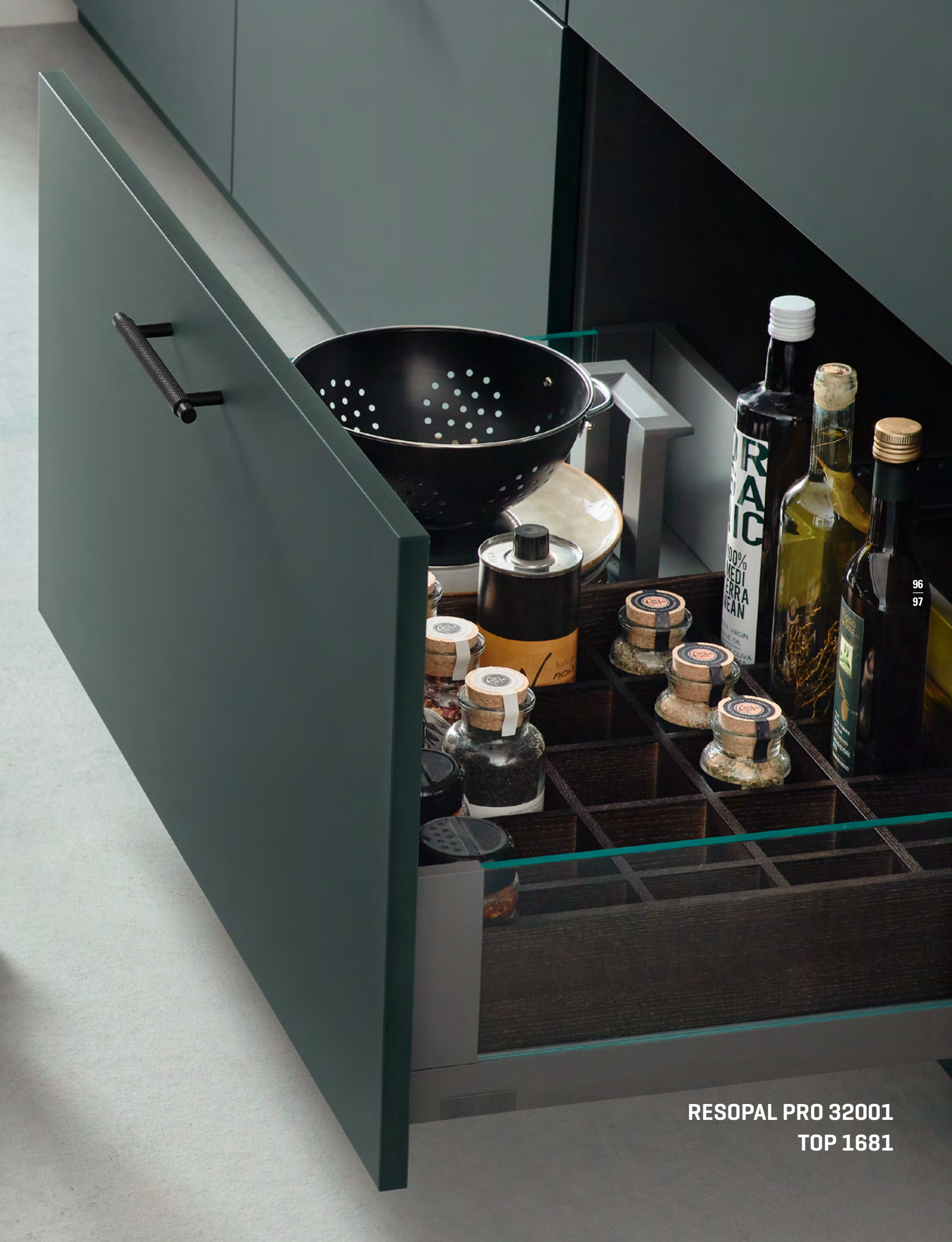
RESOPAL PRO 32001 TOP 1681