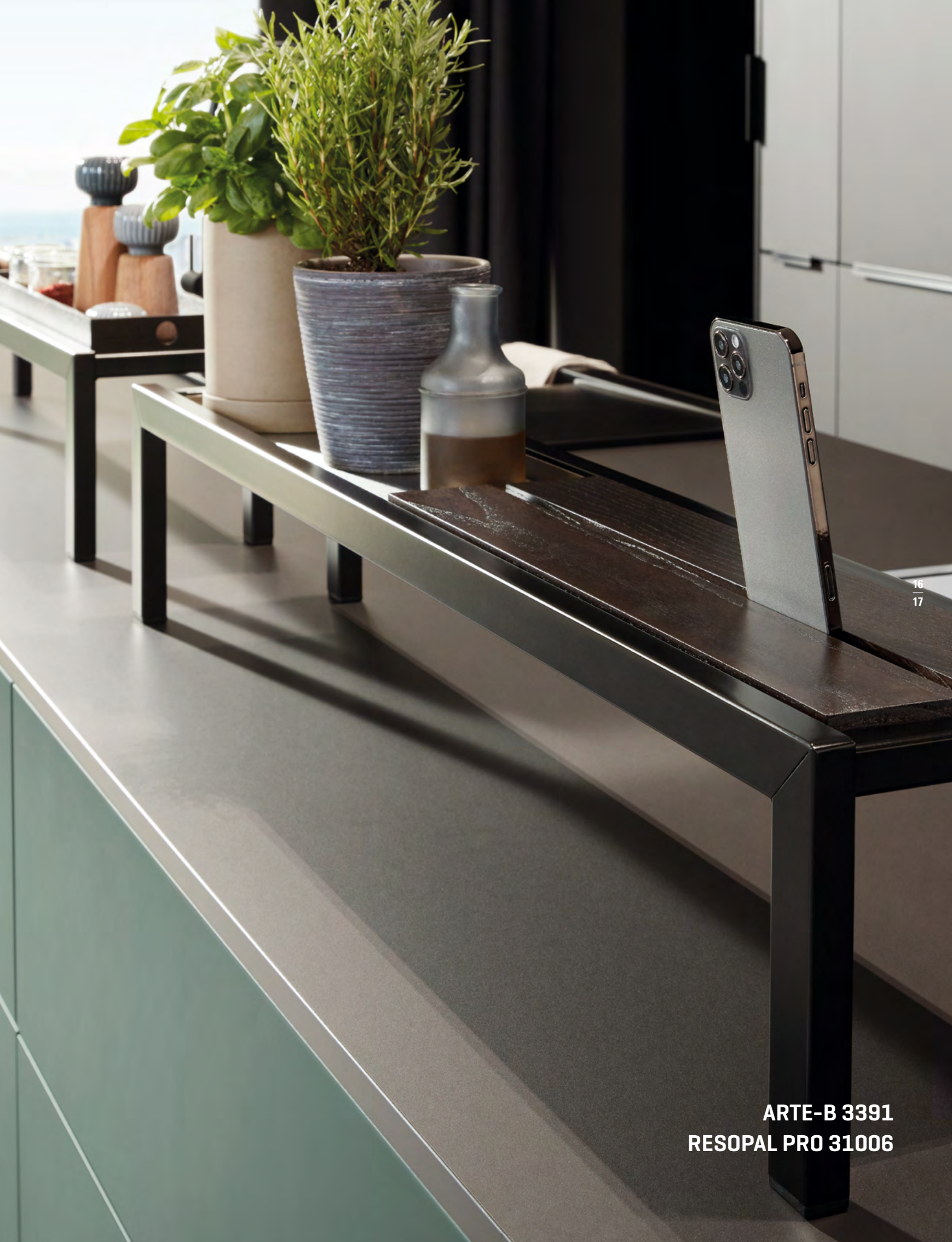
ARTE-B 3391 RESOPAL PRO 31006