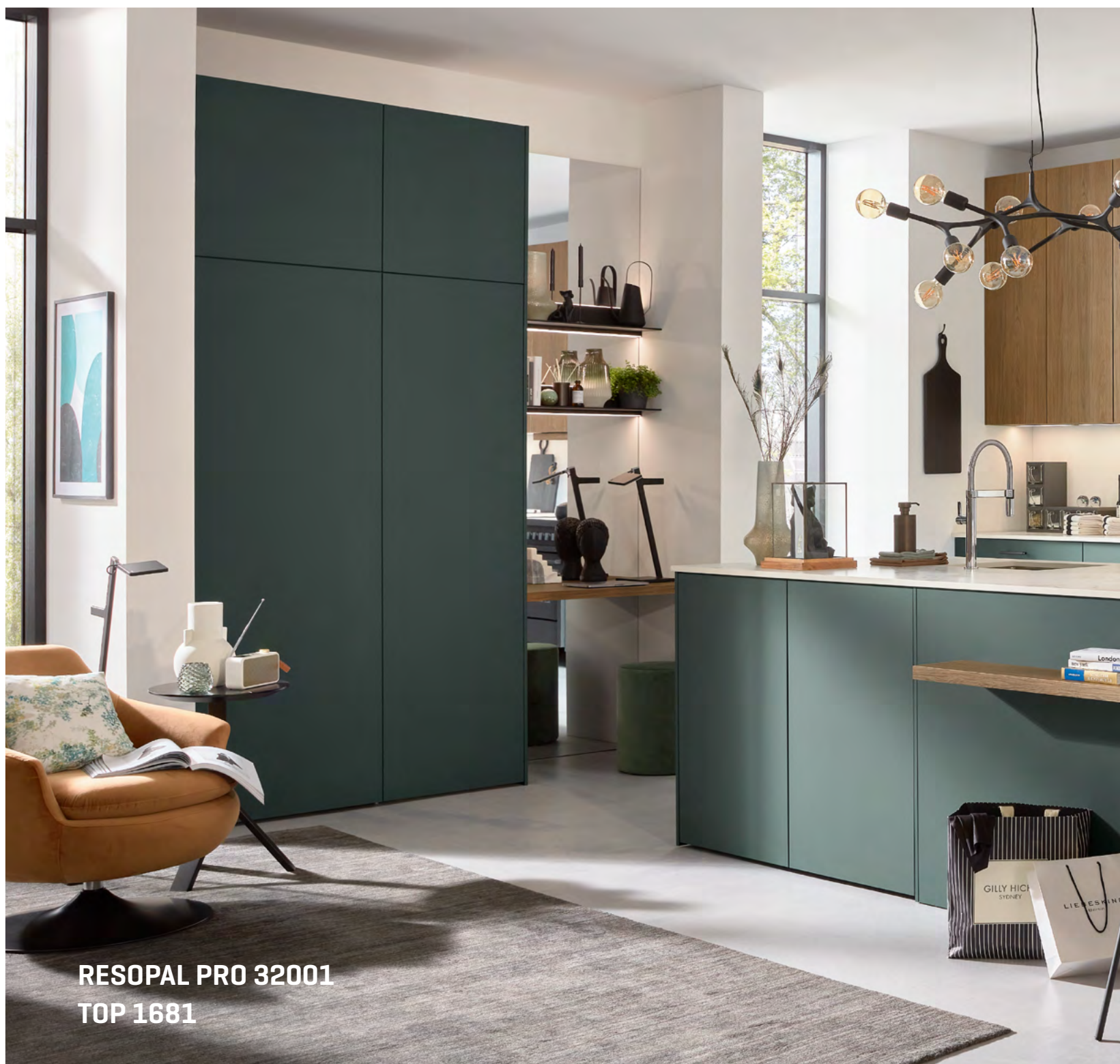
RESOPAL PRO 32001 TOP 1681

Een qua esthetiek en functionaliteit overtuigende zet is de volledige benutting van de aanwezige ruimte tot aan het plafond. Ons raster-systeem maakt iedere individuele wens- en werkhoogte mogelijk – bij onder-, boven- en hoge kasten. Alleen bij de bovenkasten kan al uit tien verschillende hoogtes worden gekozen. Wie voor een van de extra hoge kastmodellen kiest, krijgt hierdoor ook enorm veel extra ruimte. Het kort aanraken van de elegante, greeploze fronten is al voldoende om de hoge deurvleugels vrijwel geruisloos te laten openen.